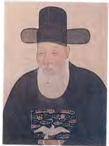
문원공 김장생의 영정