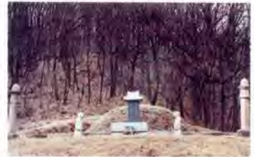
돈령공 김원록의 묘 광명시 일직동 산6번지