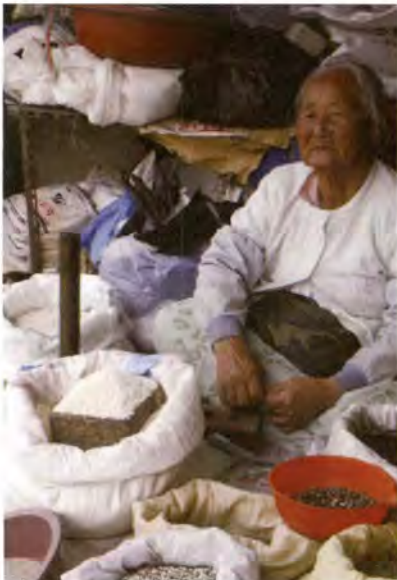
시장에서 곡물 파는 할머니의 모습

창룡문 사거리를 지날 때면 노을에 흔들리는 억새풀에 가슴이 흔들리기도 했지만 나는 방화수류정을 제일 사랑한다. 용연(龍淵)을 물들이는 버드나무의 연둑빛이 사람들의 웃음소리와 연인들의 다정한 속삭임으로 더욱 선명해지는 것을, 아이들과 도시락을 먹으며 내려다보던 봄날, 계절이 바뀌면 또 다른 모습으로 언제나 깊은 여운을 남겨주었던 방화수류정은 밤이 되면 조명등이 밝혀진 성곽과 더불어 색다른 운치를 느끼게 했고 요즘은 달빛동행이나 달빛음악회도 열리고 있어 수원화성의 빛이 점차 사람들 사이로 번져나감을 느끼게 된다.