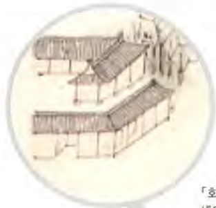
「화성행궁도」에 나타난 봉상시 (「원행정리의계도」, 국립중앙박물관 소장)

봉상시란 기구는 조선시대 국가 의례를 주관하는 관청이다. 그중에서도 특히 제사에 관한 부분을 주관하는 기구라고 할 수 있다. 우리가 흔히 조선시대 왕실에서 가장 중요하게 여기는 제사를 종묘사직에 지내는 종묘대제와 사직대제를 말한다. 역대 국왕의 위패가 모셔진 종묘의 제사는 그 어떤 제사보다도 중요하다. 또한 토지의 신과 곡식의 신에게 지내는 사직대제 역시 그 무엇보다도 중요하다. 조선시대에는 이 두 제사를 치르는 것이 무엇보다 중요해서 거의 하루 종일 이를 치르는 동안 국왕을 비롯한 모든 관료들이 추위나 더위를 가리지 않고 제사에 임한다.