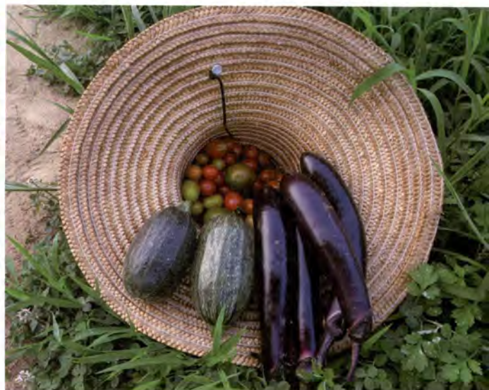
밀짚모자에 수확한 농장의 채소들