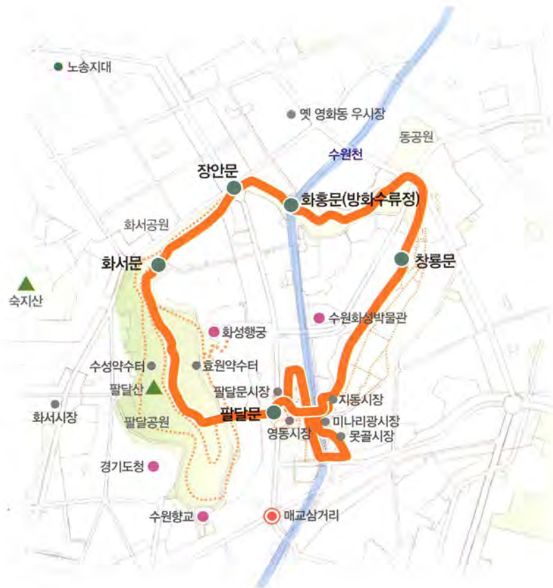
제8색 '화성성곽길' 안내도

그 중 제8색길인 화성성곽길은 화서문에서 행궁에 이르는 총거리 5.1km에 도보로 약 1시간 30분가량이 소요되는 구간이다. 사대문을 모두 아우르며 화성행궁에 이르는 화성성곽길이야말로 수원시민은 물론, 방문하는 그 누구라도 꼭 걸어보아야 할 길이다.