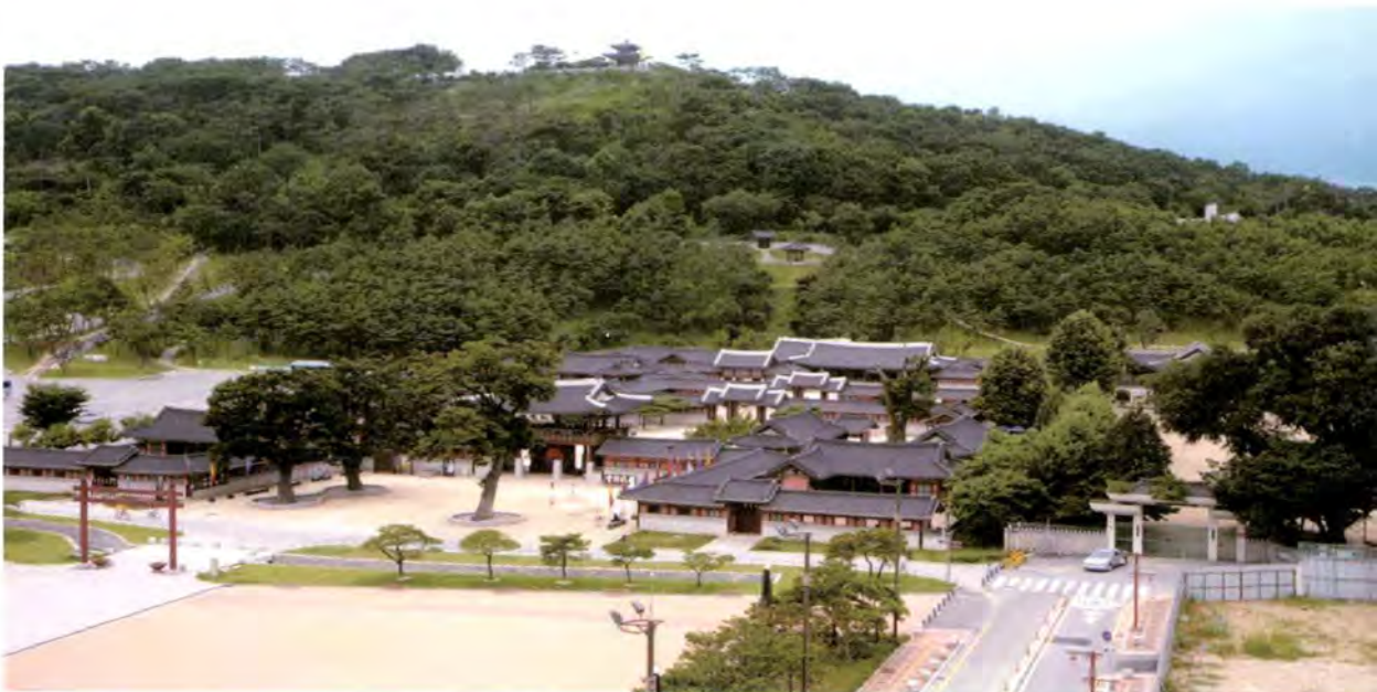
현재 수원 화성행궁 전경(수원시청 제공)

결국 분봉상시는 조선시대 다른 도시에 거의 나타나지 않는 수원지역이 특별한 기관이었음을 우리는 알 수 있다. 이것은 결국 수원이라는 도시의 위상이 다름을 또다시 확인하는 것이기도 하다.