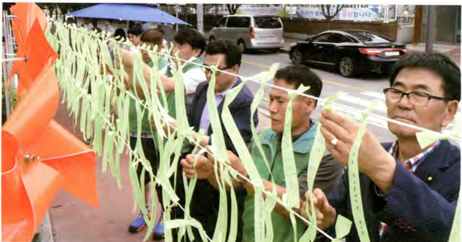
수원의료원 희망의 거리에 희망 리본을 다는 시민들

끝으로 늘 어김없이 오후 7시 전후로 긴급 상황이 발생하여 퇴근 발목을 잡아 놓던 마법같은 시간들, 비상대책 상황실에 오래도록 지워지지 않던 “오늘은 무사히”라는 문구가 원망스럽게 느껴졌던 나날들, 그리고 밤 11시, 12시가 지나면 집에 돌아와야 하는 어린자녀들 때문에 불안해하며 피로에 지친 보건소 여전사들의 눈망울들이 앞으로 오래도록 지워지지 않을 것 같다. 그이들에게 이제 마른 꽃이 된 찔레꽃 한 다발을 함께 보낸다.