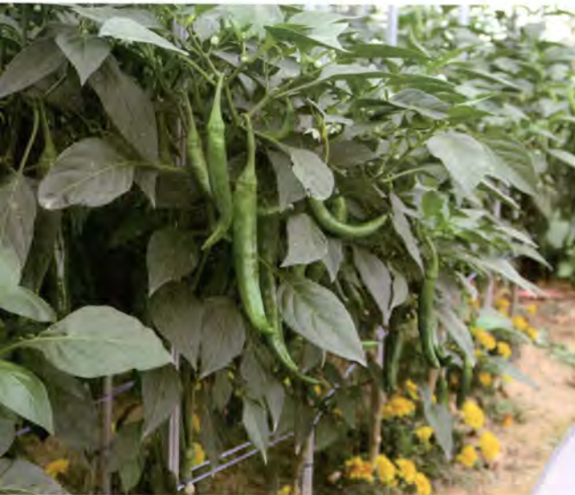
메리골드와 사이짓기를 해 병해없이 주렁주렁 열린 고추

이 작은 당수동 시민농장의 텃밭은 2015년 한 해 동안 나에게 많은 이야기를 가져다 주었고 부지런한 도시농부 친구들을 만나게 해주었다. 나는 오늘도 곧 다가올 가을의 풍요로움을 꿈꾸며, 수원에서 도시농부로 살아가기를 연습 중이다.