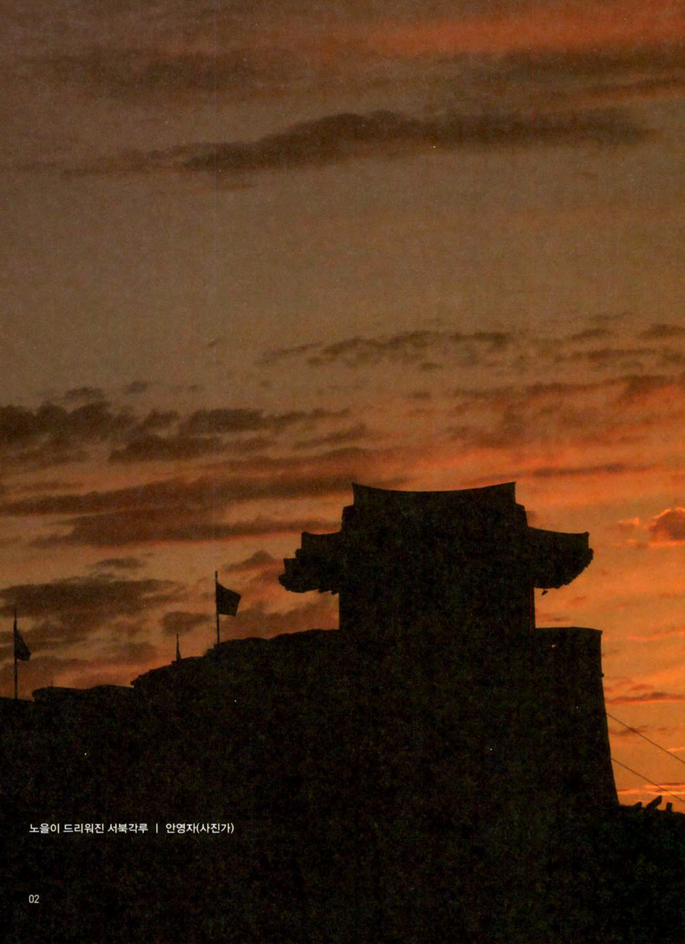
노을이 드리워진 서복각루