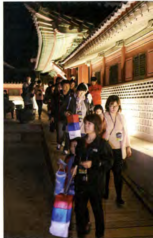
화성행궁을 관람하는 <수원화성 달빛동행> 참가자들

달빛지기의 이야기를 통해 장안문의 숨겨진 이야기들이 참가자들에게 전해지고 단순히 아름다운 건축물