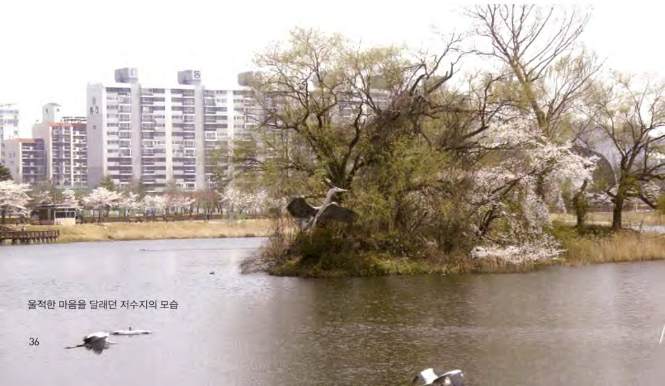
울적한 마음을 달래던 저수지의 모습

하지만 사람은 상대적 박탈감에 왜소해지기 쉬운 존재다. 부동산 광풍이 일기