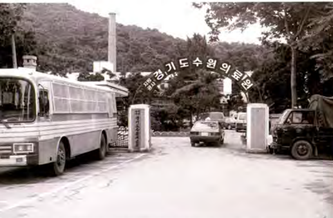
1990년 경기도립 수원의료원 정문

이후 심재덕 원장이 초대 민선시장으로 당선된 1995년 이후 복원사업은 더 활기를 띠게 됐다. 마침내 정조대왕이 수원화성을 완공한 지 200주년이 되는 1996년