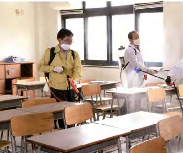
교실을 방역하는 모습

5월 22일 이후, 메르스 확진 환자가 성빈센트병원을 경유한 사실에 시민들이 크게 동요했고, 이는 인근 평택시의 발병 확산에도 크게 작용한 것으로 보인다. 수원