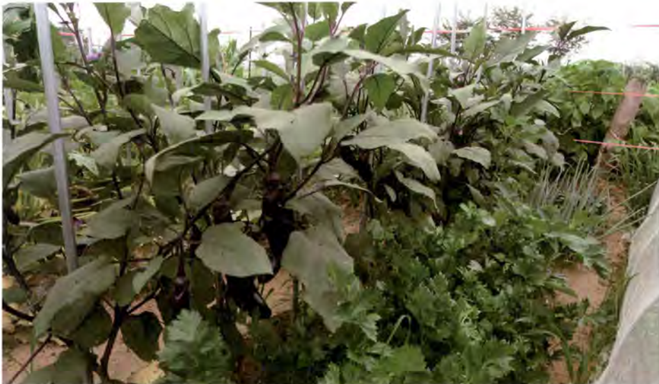
이십팔점무당벌레들과의 사투 끝에 일군 가지밭

탐스런 가지가 주렁주렁 열리기까지 매일 이십팔점무당벌레와 끊임없는 전쟁을 벌인다. 빨간색 바탕의 일곱 개의 점을 가진 칠성무당벌레와는 달리, 연한 주황빛의 이십팔점무당벌레는 가지의 달달한 과육 껍질을 인정사정없이 먹어 치운다. 10만평 텃밭에 살고 있는 해충인 이 녀석을 하루에 스무 마리 정도 눈이 보이는 대로 잡아서 없앤다. 처음에는 벌레를 보고 기겁을 했으나 지금은 맨손으로도 벌레잡이를 한다.