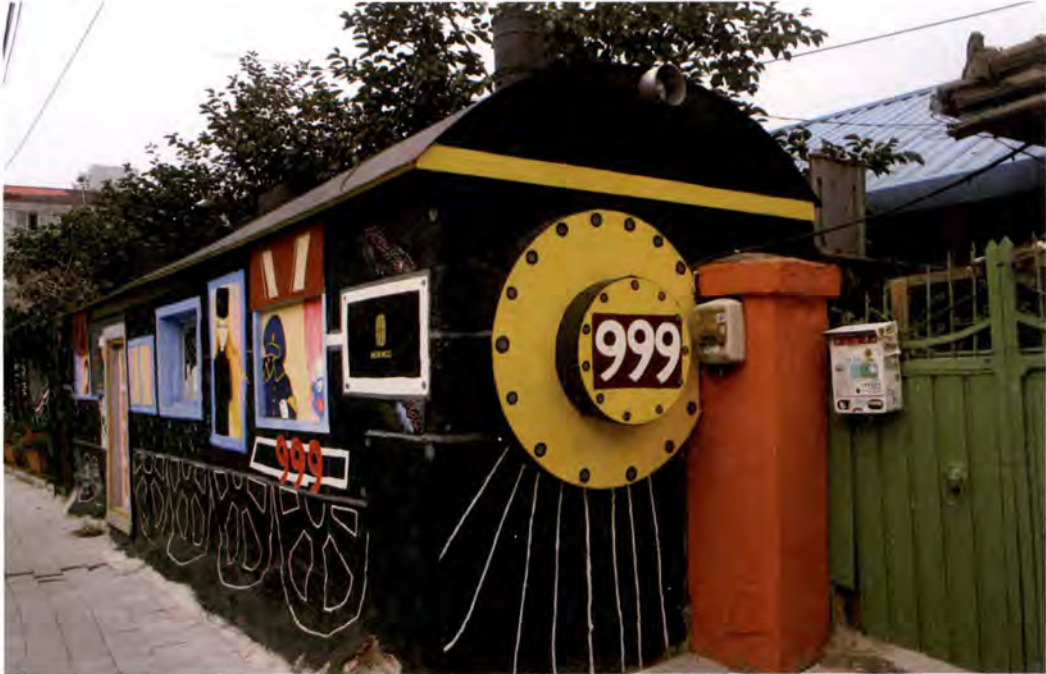
인계동 올레길에서 만나는 벽화. 화성역이 있던 자리라는 의미와의 연결이 절묘하다

에서 찾는다. '화성역'이라는 뜻을 붙이고 옛날의 철길 차단기 모양을 복원한 자리에서 시작하여 화성역과 수여선 철로에 얽힌 추억들을 찍었을 사진과 엉뚱하게 은하철도 999에 올라 탄 스머프 가족의 모습이 정겨운 골목길이다.