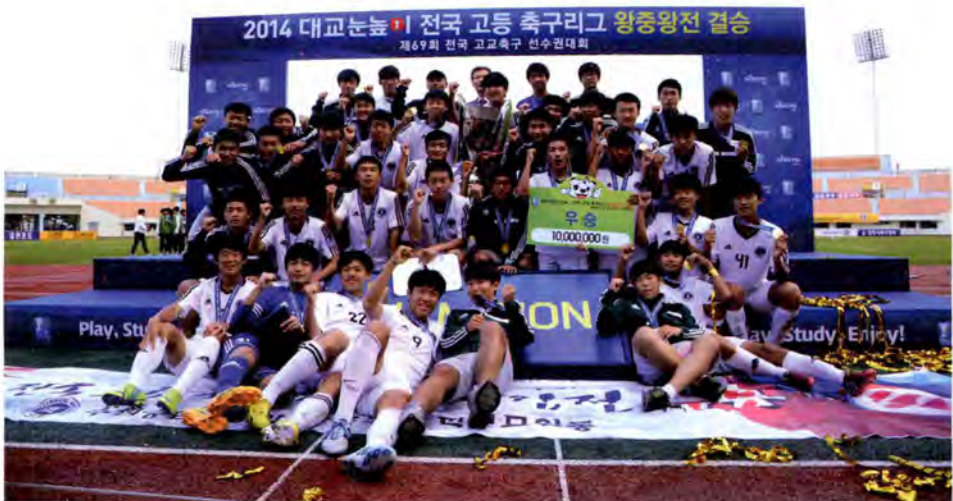
2014 전국고등 축구리그 왕중왕전에서 우승한 수원공고

수원시의 자랑인 수원공고 축구부. 세계적인 축구 스타 박지성을 배출한 수원공고. 수원공고 축구부가 있는 한 한국 축구의 미래는 밝다.