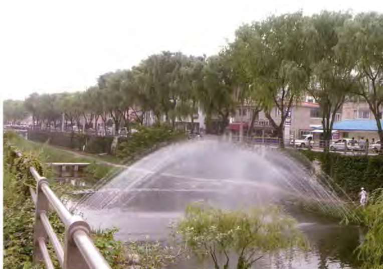
수원팔경 중 제3경 남제장류