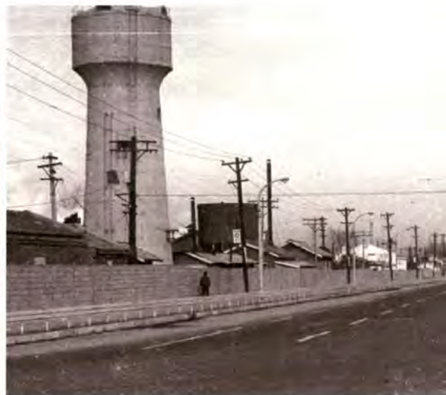
1970년대 수원역으로 가는 6차선 도로(『수원시사』19, p.220, 수원시청 소장)