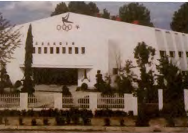
동문들의 힘으로 세운 수원농생고 광고체육관

이런 동문들의 의지로 2억5천여 만원을 들여 1천450㎡(440여 평) 규모로 1982년 10월 30일 준공식을 가진 광고체육관은 체조부는 물론 동문들에게 자부심과 긍지를 심어줬고 자랑거리가 됐다.