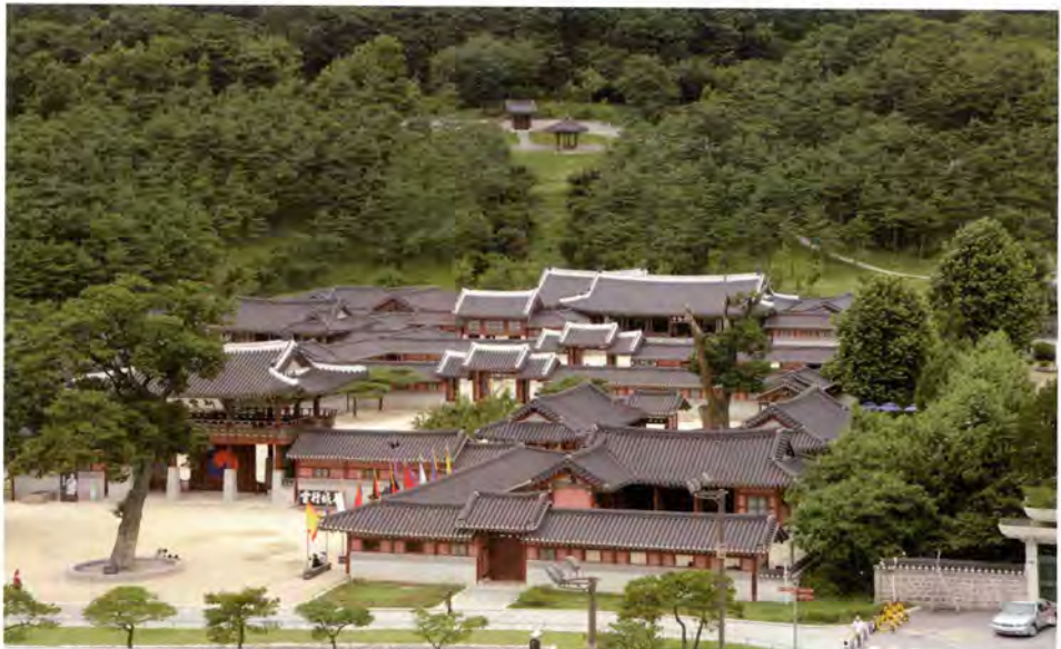
복원된 수원화성행궁 전경

지금 복원된 화성행궁을 보고 있으면 26년 전 시작된 일들이지만 어제 같다. 심재덕 전 수원시장을 비롯한 복원의 주역들은 이미 고인이 되신 분들이 많아 가슴이 아프지만 그래도 이 꿈같은 계획이 실현된 것에 스스로 놀란다.