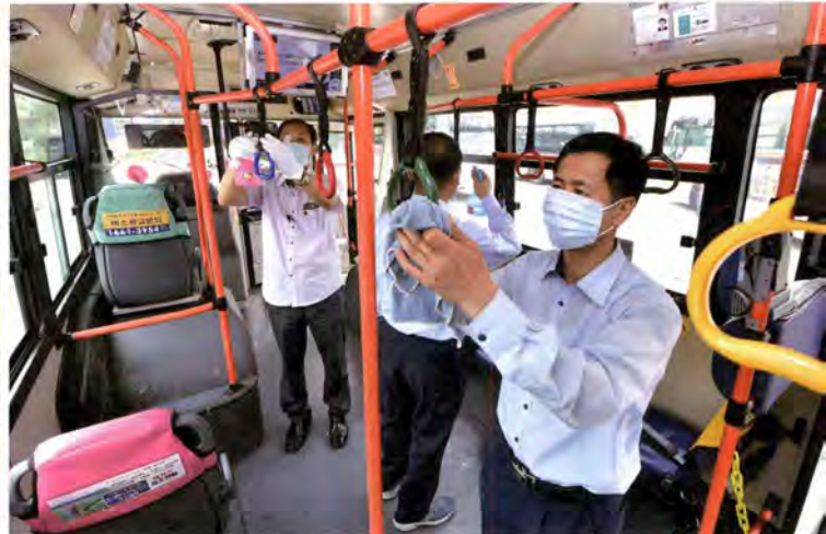
메르스 방지를 위해 매일 이뤄진 대중교통 소독