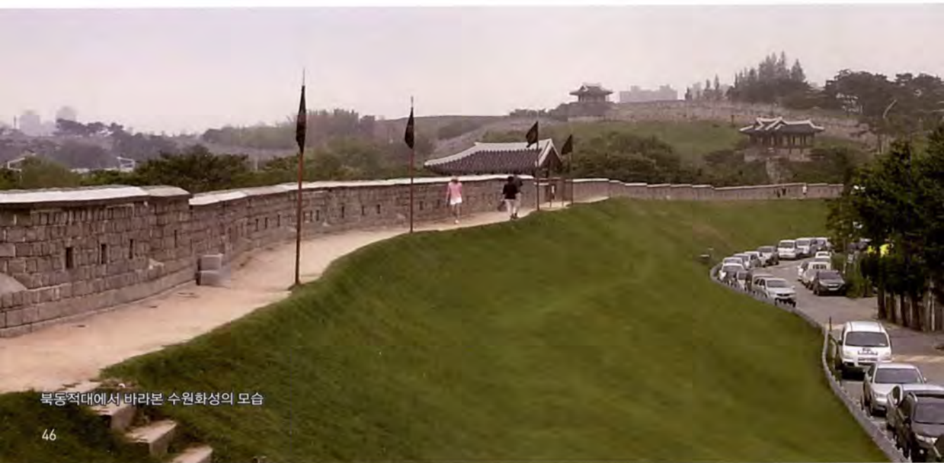
북동적대에서 바라본 수원화성의 모습

화성은 정조대왕이 아버지 사도세자의 능침을 현재의 용릉 자리로 옮겨 모시기 위해 그 곳의 백성들을 수원으로 이주시키면서 축성한 것이다. 220년 세월의 무게와 역사를 느끼게 하는 성벽의 빛깔이며 빈틈없이 정교하게 채워 쌓은 성돌들의 모양새는 숙연한 마음마저 들게 한다.