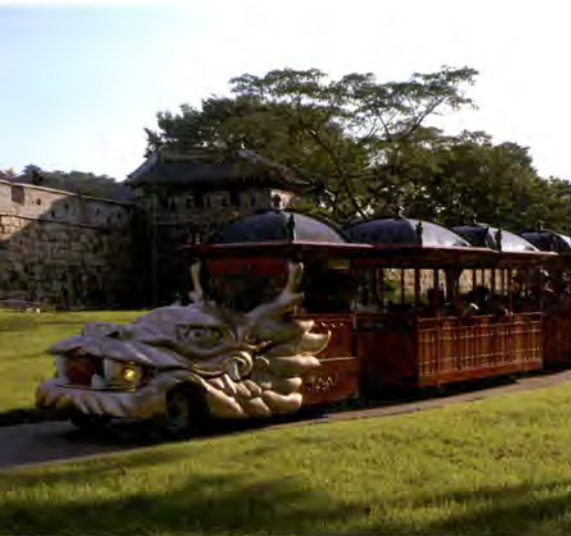
성 박 공원을 달리는 화성열차

이제 종점이 멀지 않다. 팔달문을 거쳐 팔달산으로 오르자면 국립교육기관이었던 수원향교가 있고, 조금 더 올라 팔달산 중턱의 산책로로 나서 오른쪽으로 길을 잡으면, 화성을 지키는 신을 모셨던 사당인 성신사 앞에 이르게 된다. 그 곳에서 오솔 길을 따라 아래로 내려가면, 화성성곽길 답사의 대미를 장식할 화성행궁이 오늘의 방문객이 될 당신을 기다리고 있다.