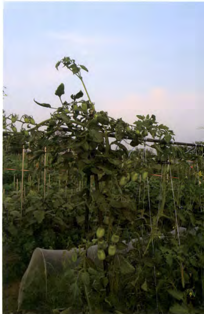
다행히 무럭무럭 자라준 토마토

하지만 좌절도 잠깐 뿐, 며칠 후에 자연의 놀라운 섭리는 생장이 멈춘 토마토 모종 가지 옆에서 굳은 땅을 뚫고서 새로운 싹이 났다. 지금은 어느 밭보다도 풍성한 토마토 군락을 이루며 매일 달콤한 토마토를 수확하고 있다.