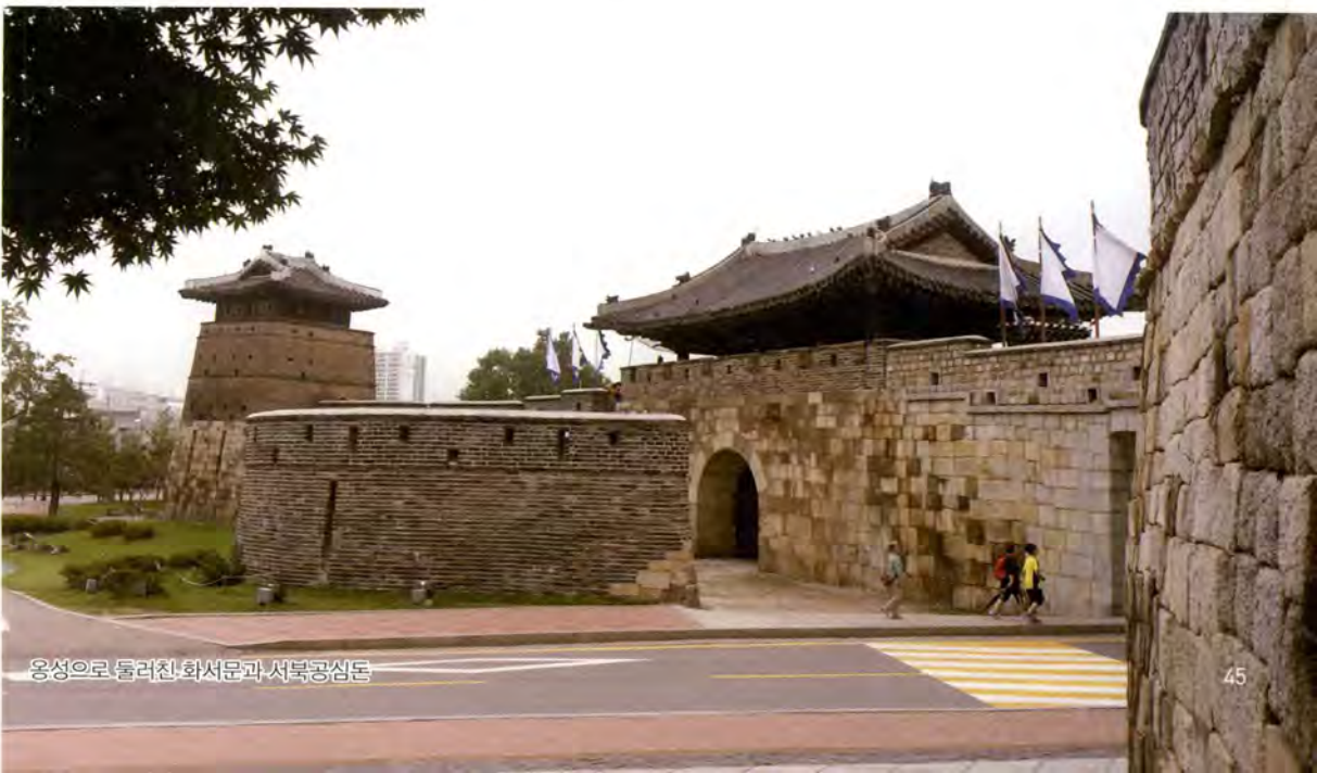
옹성으로 둘러친 화서문과 서북공심돈

장안문의 문루를 통과하여 차도를 건너면 그곳 역시 성 밖은 고즈넉하게 사색에 잠겨 걸을 수 있는 숲길이 조성되어 있다. 첫 시설물인 북동적대 앞에서 화홍문 쪽을 바라보면, 멀리 방화수류정과 각건대가 보이고, 푸른 잔디와 나무들 사이로 구불구불 오솔길이 보이는 빼어난 경관이 발길을 멈추게 한다.