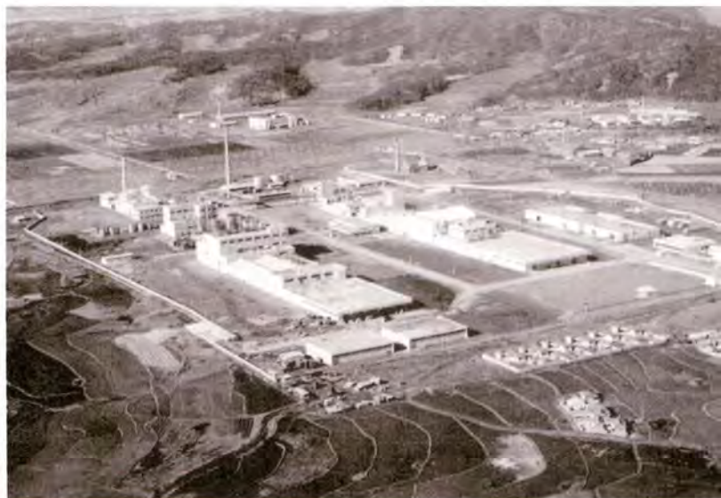
평동에 있던 선경합섬(『수원시사』6, p.300, 2014)