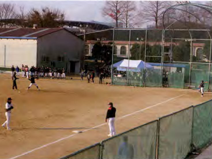
야구인의 밤 - OB 대 YB 경기

지난해 봉황대기를 9년 만에 되찾으려다 아쉽게도 준우승에 머물렀다. 평소에는 '호랑이 선생님'으로 통하던 이성렬 감독은 눈물을 글썽이는 선수들을 하나하나 안아주며 격려와 위로를 아끼지 않았다. 아버지와 아들 사이 같은 이 감독과 선수들. 열악한 여건 속에서도 수원의 야구 자존심을 지켜주고 있는 유신고의 돌풍은 앞으로도 계속되리라 믿는다. 특히 수원을 연고지로 한 kt wiz의 창단은 이들에게 더욱 힘을 실어줄 것이다.