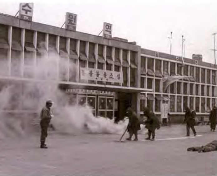
1970년대 수원역의 모습(『수원시사』1, p.530)

셋길이라지만 2차선 포장도로고, 길 양쪽으로는 인도도 있다. 3번 시내버스가 다니는 꽤나 먼 십여 분 길이지만 꼬마 소년은 앞만 보고 걸어가고, 얼마 지나지 않아 여기저기 재잘재잘 친구들로 북적댄다. 드디어 '세류국민학교' 이름이 선명한 교문에 들어서면 수십 년 느티나무 우거진 높다란 계단식 축대, 축구 골대 덩그러니 널따란 운동장, 삼면 둘러친 웅장한 4층 교실의 건물들이 꼬마 소년을 차례대로 맞이한다.