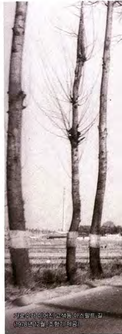
가로수가 이어진 고색동 아스팔트 길 (1978년 12월,)

다시 출발한 시외버스는 짧은 급경사의 길을 살살 내려간다. 추운 겨울 눈이라도 내리면 하굣길의 시외버스가 웅웅 헛바퀴를 돌며 끽끽거리고 오르던 작은 비탈길이다. 평지 길에 접어들고 오목