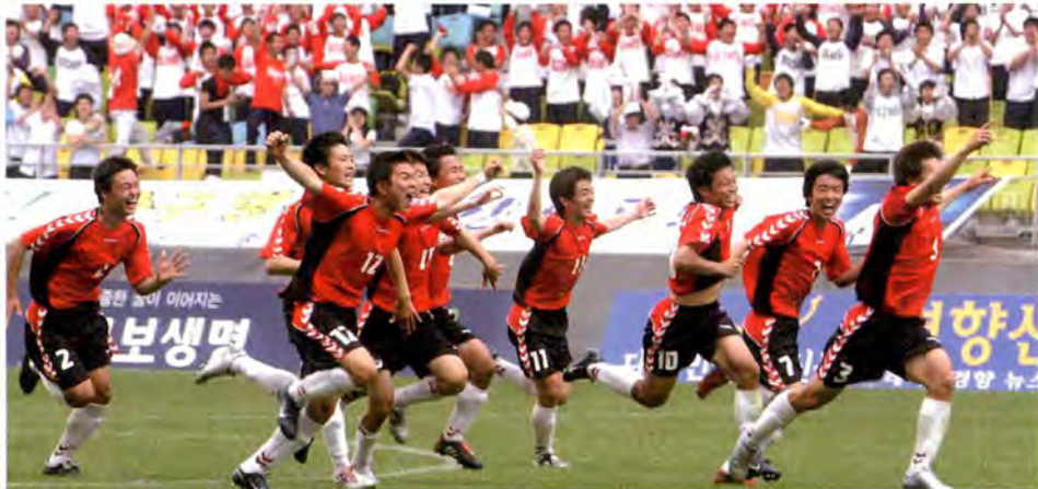
2005년 제38회 대통령금배 고교축구대회에서 승리한 후 환호하는 수원공고 선수들

수원공고는 한국 고교 축구대회에서 가장 규모가 큰 대통령금배도 손에 넣었다. 2005년 6월 수원월드컵경기장에서 열린 제38회 대통령금배 전국고교축구대회 결승에서 중동고와 2-2로 비긴 뒤 승부차기에서 3-2로 누르고 사상 첫 우승컵을 차지했다. 이어 수원공고는 6년 뒤인 2011년 8월 제44회 대통령금배 전국고등학교 축구대회에서 보인고를 3-2로 누르고 또다시 정상에 오르는 저력을 보여줬다.