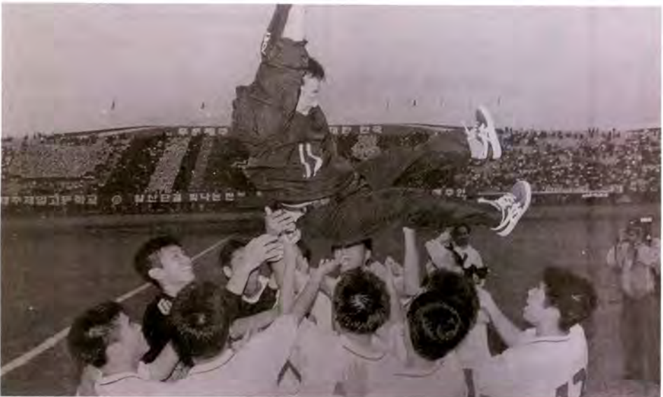
1998년 10월 제79회 전국체전에서 사상 첫 우승컵을 차지한 수원공고

수원공고의 우승컵은 이후에도 계속됐다. 2000년 10월 제81회 전국체육대회 결승에서 마산공고를 3-1로 누르고 2번째 전국체육대회 우승컵을 가져온 수원공고는 한·일 월드컵이 치러지기 전 열린 제46회 청룡기 전국중고축구대회에서 부산정보고를 승부차기 끝에 7-6으로 꺾고 우승컵을 거머쥐었다. 그 뒤 월드컵이 끝난 9월 제57회 전국고교축구선수권대회에서도 강릉농공고를 승부차기 끝에 8-7로 제압하는 등 역사적인 승리를 거뒀다.