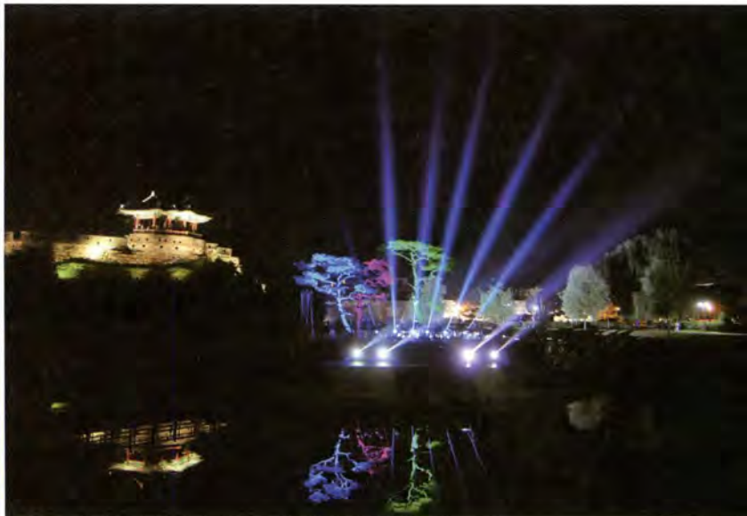
방화수류정에 열린 달빛음악회