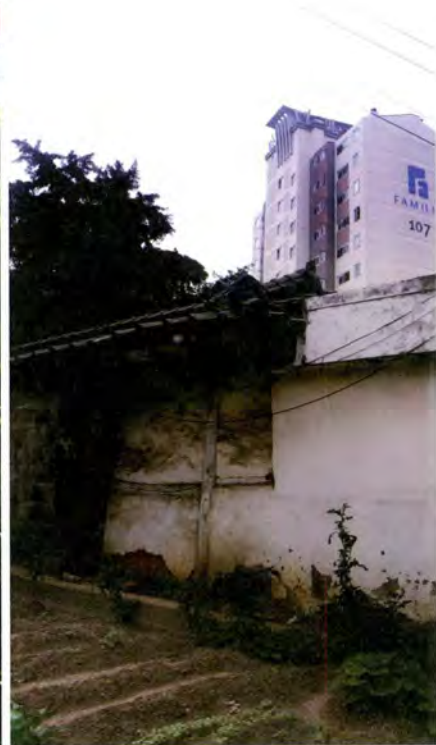
도시의 빛과 그림자, 인계동의 고층 아파트 바로 뒤에 자리 잡은 구도심 주택가의 모습