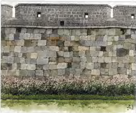
표지 화성-성벽2 | 오용길(화가)