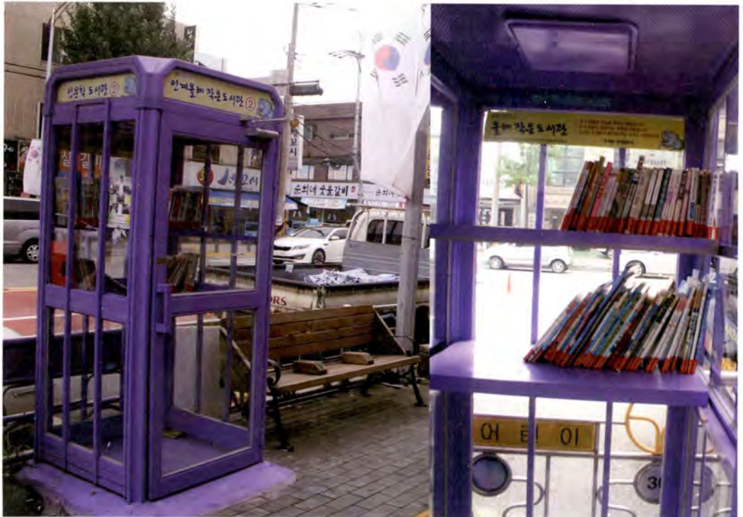
인계동의 올레 작은 도서관

그렇게 행정단체와 마을 주민의 힘이 합하여져, 화성역이 있던 자리에서 뒷집을 쥐고 천천히 인계동 올레길을 올라 인문학이 활짝 핀 장다리길을 건너 KBS드라마센터와 경기도문화의전당, 수원제1야외음악당까지 이어지는 길을 걸어볼 수 있는 날을 기대해 본다.