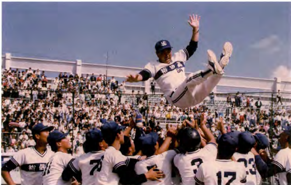
1989년 전국체전에서 우승한 유신고 야구부

대통령기·청룡기·봉황대기·황금사자기 등 4대 고교 야구대회 우승은 아니었다. 하지만 경기도의 입장에서는 1986년 제67회 서울체전 이후 3년 만에 종합우승을 탈환하는데 기여했고, 야구종목 우승의 견인차 역할을 했기에 값진 것이었다. 효자