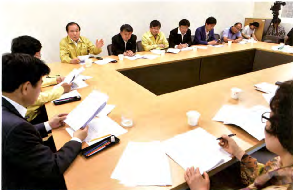
수원시 메르스 비상대책본부 회의

조선시대 임금의 일기인 일성록(日省錄)은 1760년(영조) 1월부터 정조대왕을 거쳐 1910년(순종) 8월까지 151년간의 국정에 관한 제반 사항을 기록하고 있다. 이 일성록에 정조 12년 5월 중순부터 도성에 역병이 돌기 시작한 뒤 9월 10일까지 병민의 치료와 관리 현황을 보고한 내용들이 전후의 과정을 포함하여 소상하게 실려 있다.