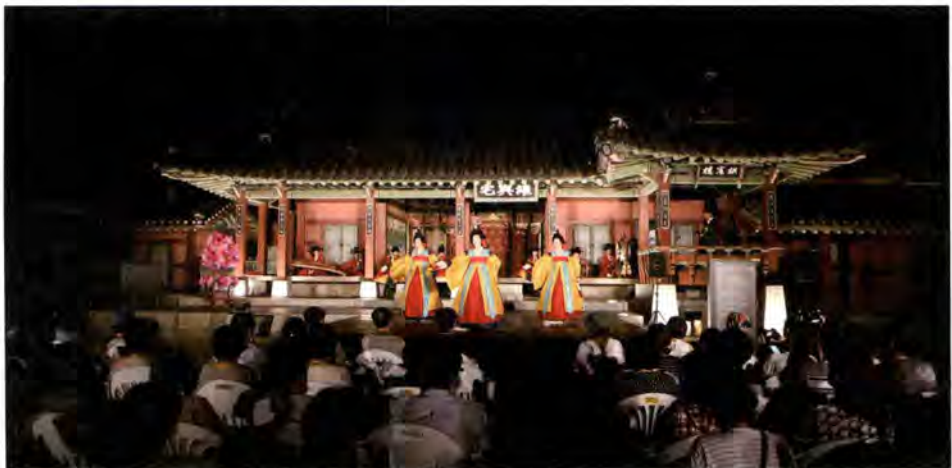
유여택에서 열리는 달빛동행 공연