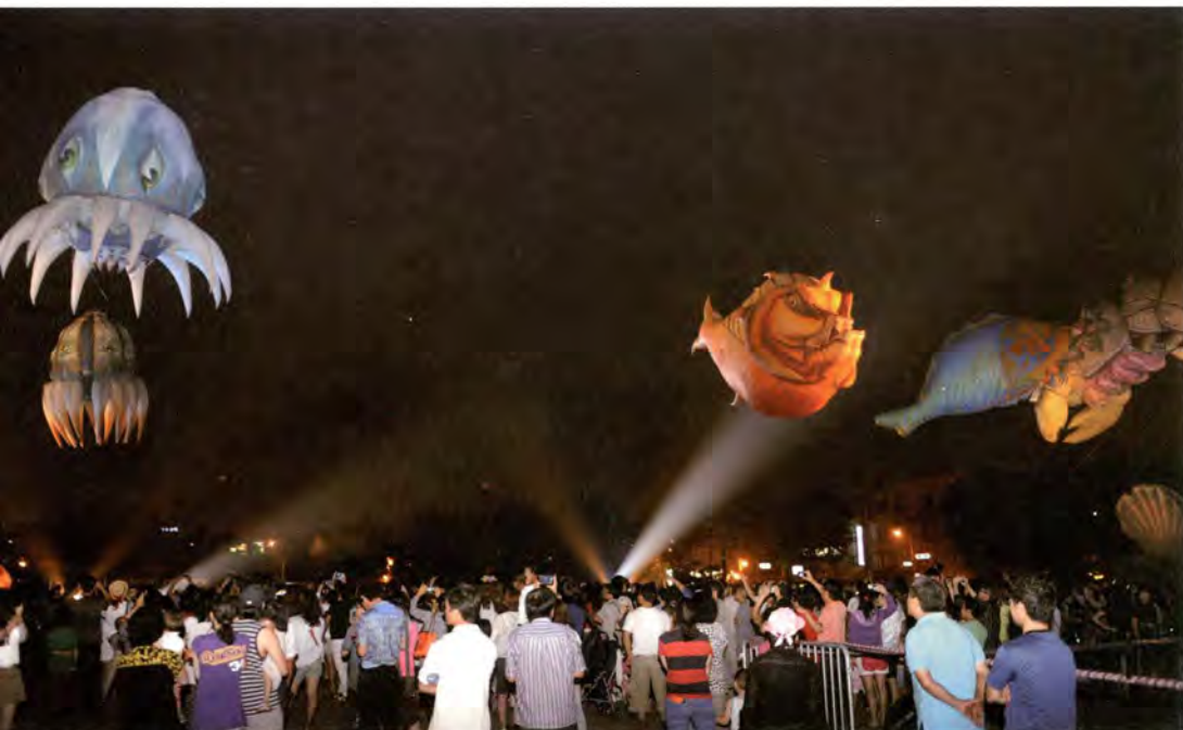
수원화성국제연극제(현, 수원연극축제)를 즐기는 시민들의 모습

연극제뿐 아니라 화성국제음악제, 화성행궁에서 펼쳐지는 각종 공연 등, 이렇게 나는 일 년 내내 다양하게 펼쳐지는 수원에서의 문화적 체험을 통해 내가 살고 있는 곳의 위대하면서도 소소한 아름다움에 어느 순간 저절로 스며들고 있음을 깨닫게 된다.