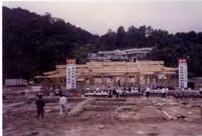
1997년 9월 12일 봉수당 상량식(『수원문화원 50년사』)