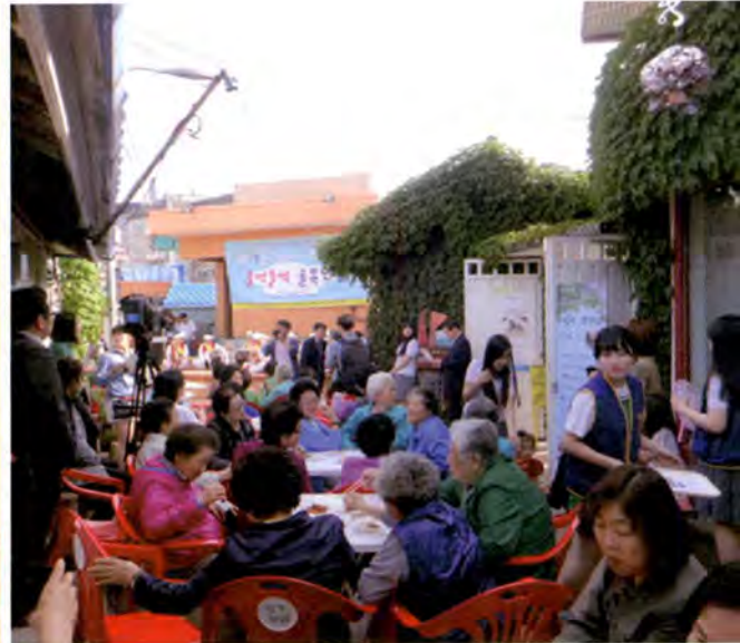
마을 주민들과 학생들이 함께 즐기는 골목 축제의 모습