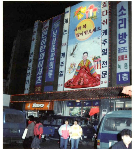
영동시장 내 크로바백화점

1991년 12월 영동시장의 전통시장과 그 안의 미니급 백화점들과 거리가 멀지 않은 곳