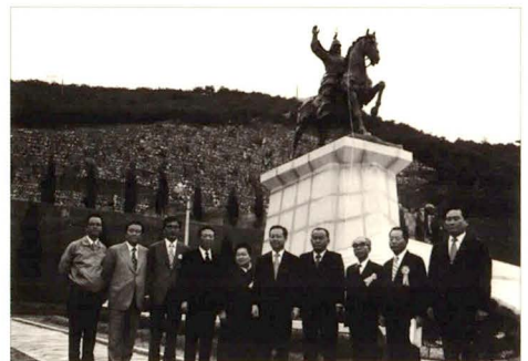
강감찬 장군 동상 건립(1972. 5. 4)

1972년 5월 4일 팔달산 중턱에 강감찬 장군 동상이 건립되었다. 이후 이곳은 수원의 대표적인 명소가 되었다. 70년대 이후 수원을 상징하는 기념물이 되었다. 많은 사람들이 자주 찾는 팔달산 중턱에 우뚝하게 세운 강감찬 장군 동상은 20년간 수원을 상징하는 인물이었다. 군사정권의 국가적 위인 만들기 사업은 국난을 극복한 장군들을 우선으로 하였고 수원과 상관없는 인물일지라도 그 상징적 의미를 거부하지 못하게 만들었다.