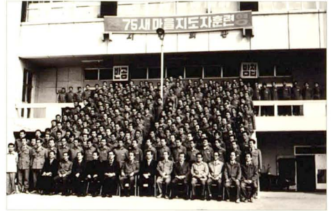
새마을 지도자 교육 - 수원시민회관 (1975. 03. 17)

이에 따라 국정 및 시정홍보를 위한 군중 동원이 가능한 수원시민회관과 공설운동장이 새롭게 건립된 것도 이 시대의 일이다. 1970년 12월 팔달산 중턱에 수원시민회관이 건립되었다. 정부 및 시정 시책의 홍보 선전과 지역사회 문화향상을 위한 각종 간행물 및 사진의 전시, 정부시책 또는 문화활동을 위한 영화·연극·음악·무용