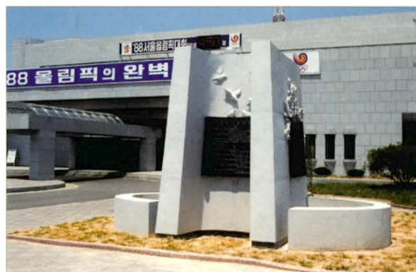
시민헌장비(1987. 6. 24)

이러한 수원에 대한 자부심과 수원시민으로서의 역할과 자세의 요구는 경기도청이 수원으로 이전이 결정된 직후의 일이다. 수원의 역사문화적 자부심은 도청 이전부터 〈수원시민헌장〉으로 명문화되어 내재화되기 시작한 것이다. 이에 대한 확연한 기념물의 증거를 세우게 되는 것은 20년 이후의 일이다. 〈수원시민헌장〉의 글을 새긴