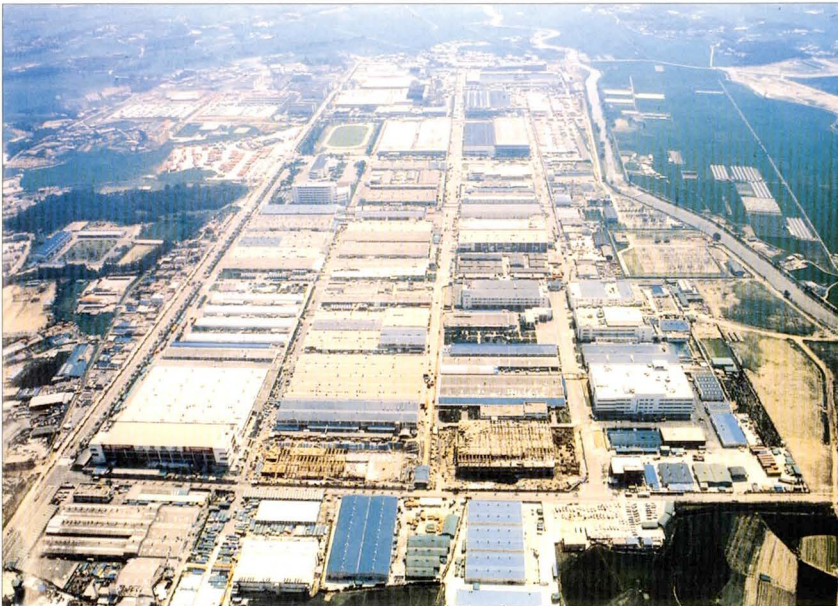
삼성전자 수원공장 전경(1989)

1970~80년대 20년간 삼성전자의 성장은 한국경제의 성장과 맥을 같이하는 것이었고, 삼성전자와 연관된 하청업체를 포함한 경제규모는 수원 경제에 압도적 영향력을 갖게 되었다. TV·냉장고·에어컨·전자렌지 등 백색가전을 만드는 공장에 취업한 수많은 직공들은 수원의 경제를 역동적이게 만들었다. 그래서 삼성전자의 월급날이면 남문일대 상권의 활기찬 모습이 확연히 눈에 보일 정도였다.