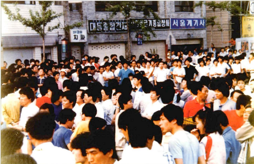
수원 팔달구 지동 거리 집회(1987. 6)

이후 6.29선언과 1987년 대통령 직선제를 통한 제도적인 민주주의 틀이 형성되었고 이후 이 체제가 지속되고 있다. 이를 '87년 체제'로 일컫는다. 1987년 6월 항쟁이 만든 거대한 역사적 변화는 지금도 지속되는 것이라 하겠다.