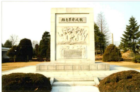
녹색혁명 성취 기념탑

한편 통일벼를 통한 쌀의 자급자족은 1972년 10월 유신을 합리화해 주는 기제로 활용되었다. 통일벼의 성공은 식량문제를 해결함과 동시에 경제발전을 추진하는 원동력이 됨으로써 박정희 정권의 정치적 위기를 막아 내는 효과를 발휘하였던 것이다. 수원은 정조 이래 화성 축성과 서둔·북둔의 조성으로 자급자족적인 도시가 될 수