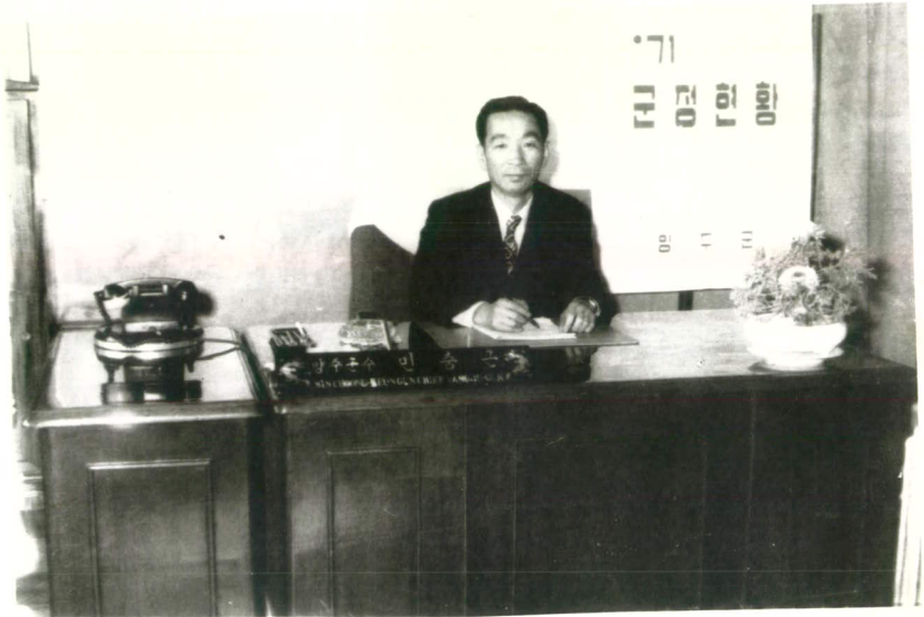
〈군수님 집무〉 광경